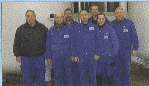
Die Wasserkolonne – täglich für Sie im Einsatz.