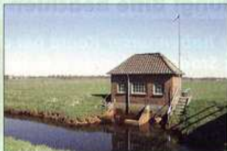
Stinstedter Randkanal Basmoor Schöpfwerk