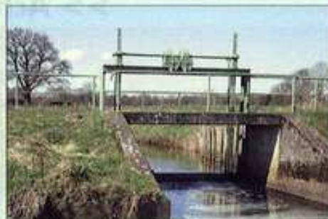
Fickmühlener Randkanal Stauanlage