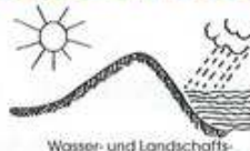
Wasser- und Landschaftspflegeverband Bederkesa